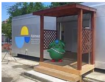
あまみず科学センター