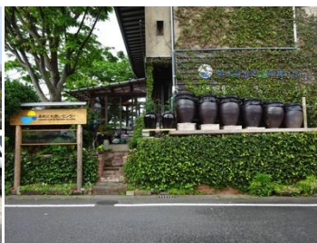
あめにわ憩いセンター