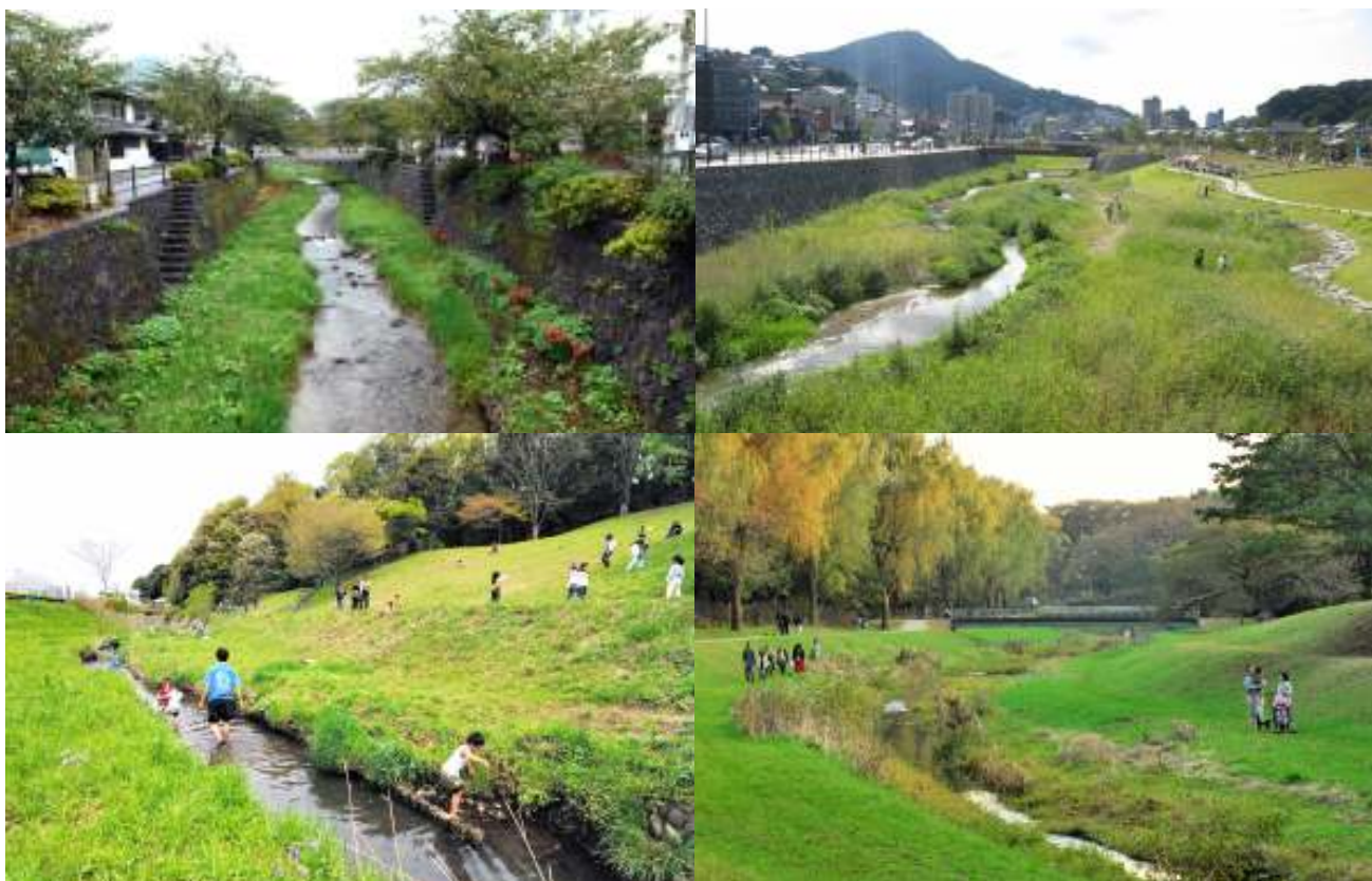
写真（右上より時計回りに）：板櫃川（北九州）・野川（東京）・梅田川（横浜）・一の坂川（山口）

「日本の“いい川”シンポジウム」は、「日本の川が変わる～多自然川づくりの新たな挑戦～」をテーマに、その理念や方策を共有し、官民協働で推進していくための議論の場として2007年2月にスタートしました。以来、第2回「多自然川づくりの手法」、第3回「多自然川づくりの実践に向けて」をそれぞれテーマとし、各地の川づくりの現場の声も交え、多自然川づくりを具体的に進めていくための課題と方策について議論してきました。この第4回は、昨年の議論「中小河川の川づくりの技術と多様な主体の参加・協働」を引き継ぎ、特に要望が多かった「都市河川の多自然川づくり」をテーマにします。